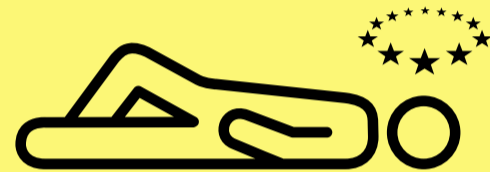
Mynd yn anymwybodol