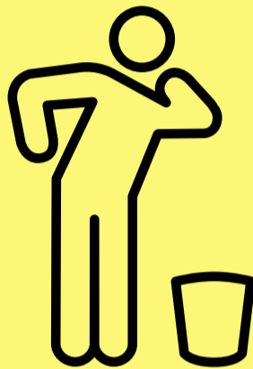
Eisiau taflu i fyny